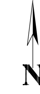
SCHITA DE RACORDARE A PLANSELOR

Copie spre publicare Scara 1:2000 Sistem de proiectie "STEREO '70" - Plansa 1 -