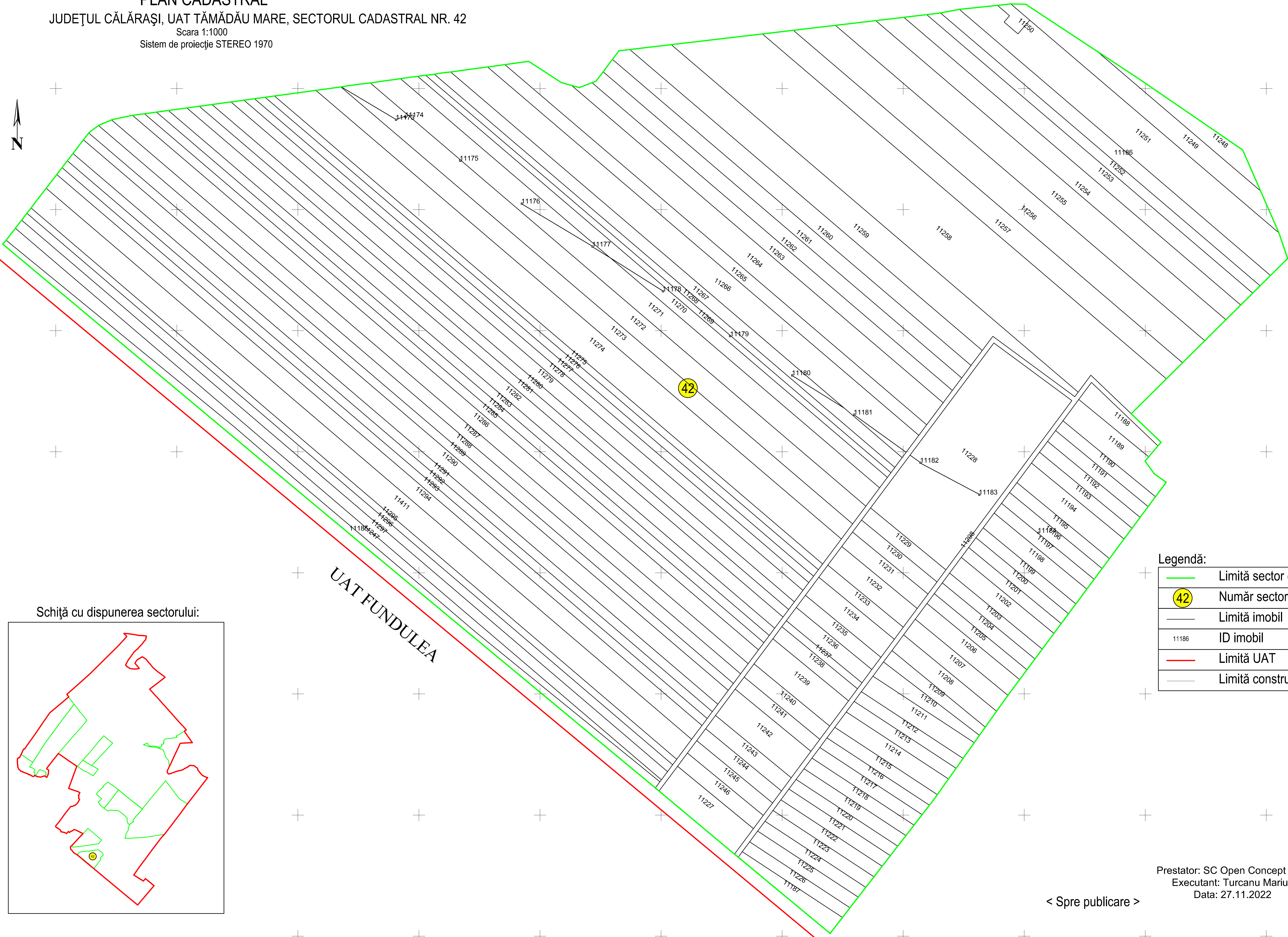
Schiță cu dispunerea sectorului: