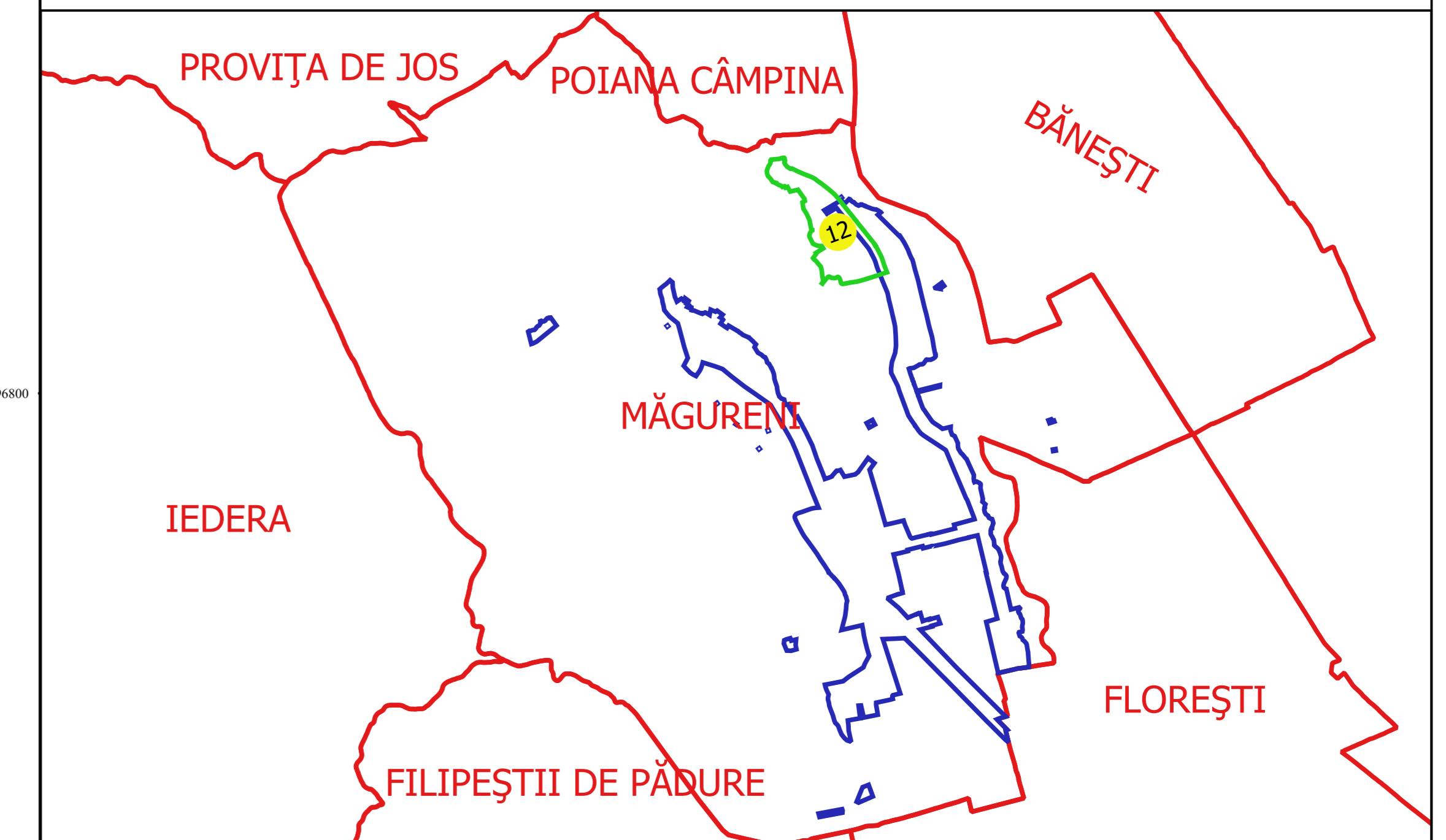
Schița dispunerii sectorului cadastral