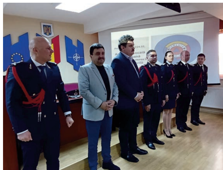
Protecția Civilă este o componentă a sistemului securității naționale

Astăzi, atribuțiile protecției civile sunt îndeplinite