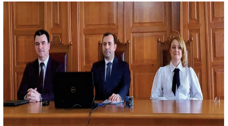
RAPORT. În ciuda numărului mare de dosare pe cap, magistrații sătmăreni s-au descurcat bine în 2023

are gradul „foarte eficient” la nivelul Tribunalului Satu Mare în perioada 01.01.2023 - 31.12.2023.