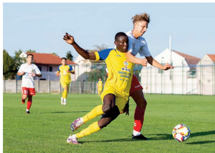
când CSM Olimpia va juca cu MCMXXI cu Minerul Ocna Victoria Carei, iar Olimpia Dej.

Sezonul de primăvară din Liga 3 va debuta pe 9 martie