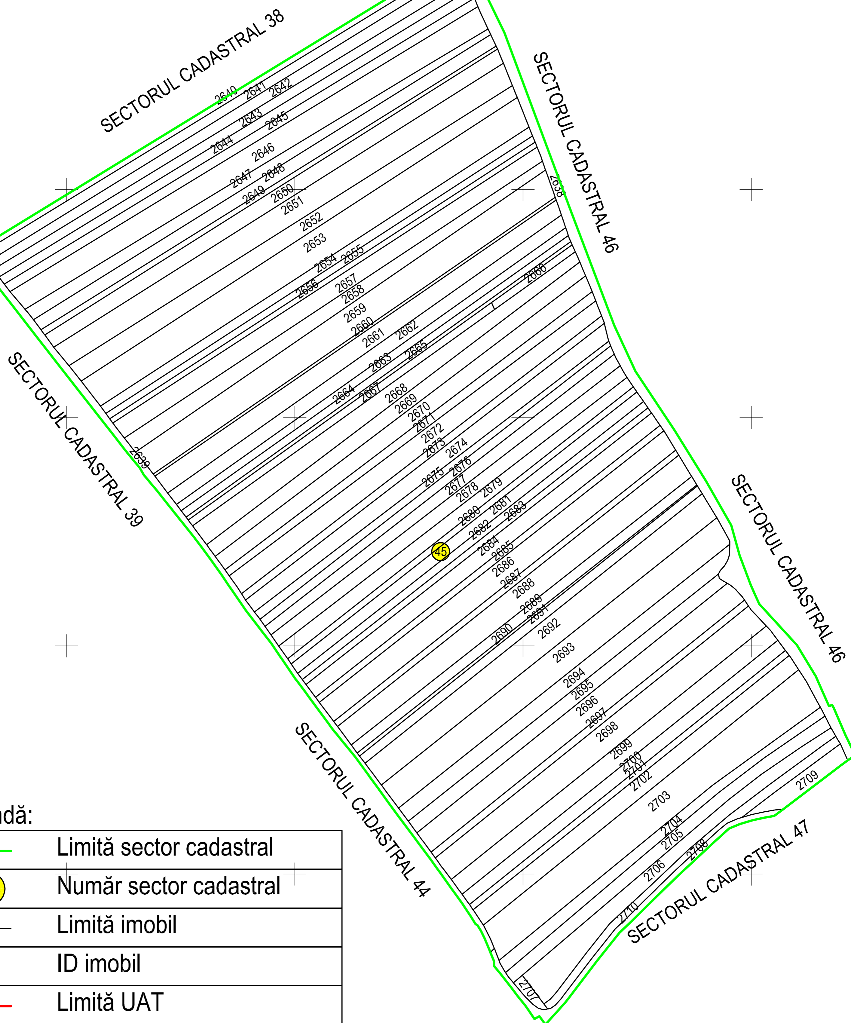
Schiță cu dispunerea sectorului: