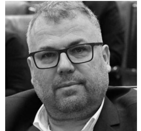
Camerei de Conturi Timiș, abateri semnificative.

”În exercitarea atribuțiilor de gestionare a finanțărilor nerambursabile, Centrul de Proiecte a înregistrat, potrivit raportului