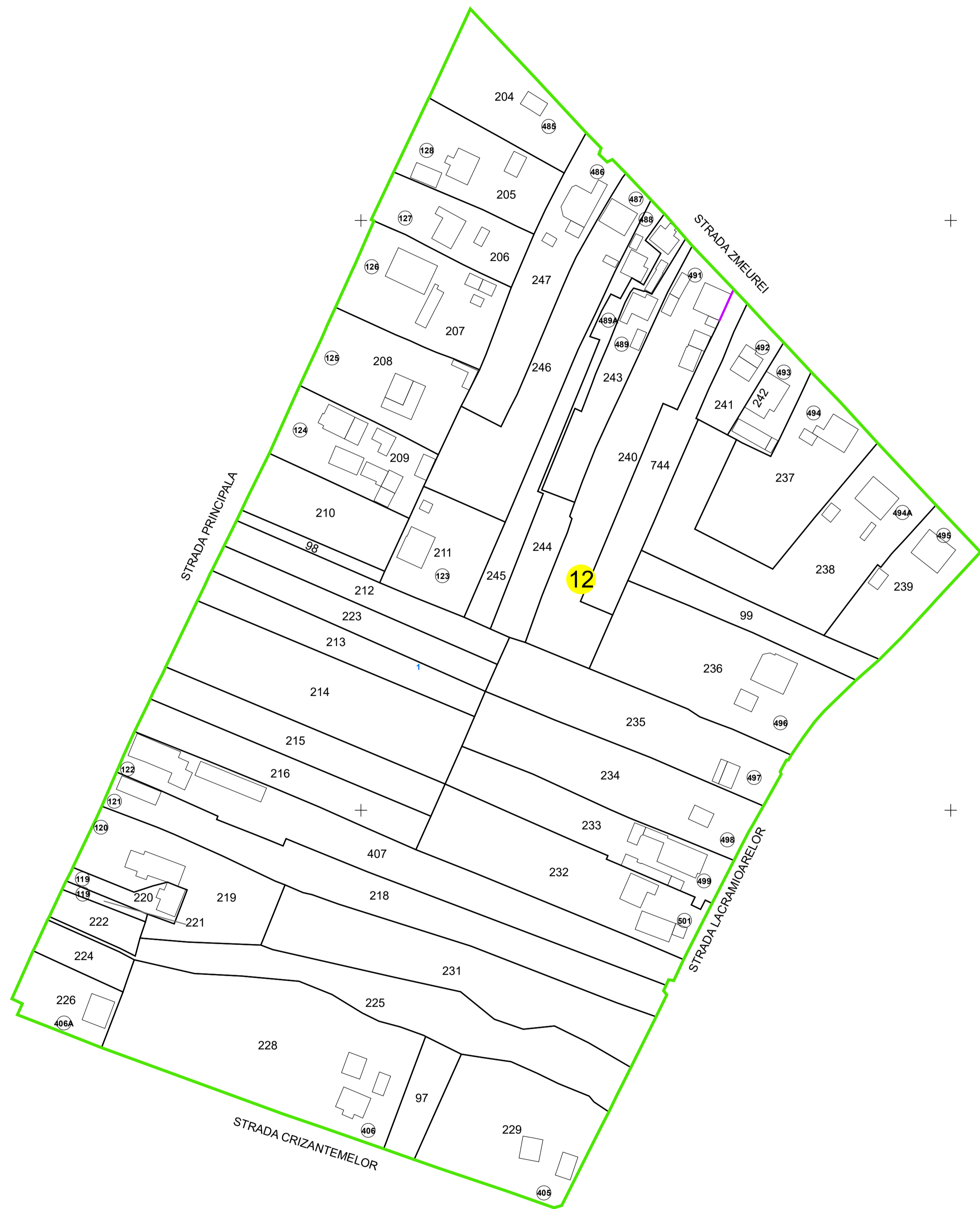
SCHIȚA DISPUNERII SECTOARELOR CADASTRALE