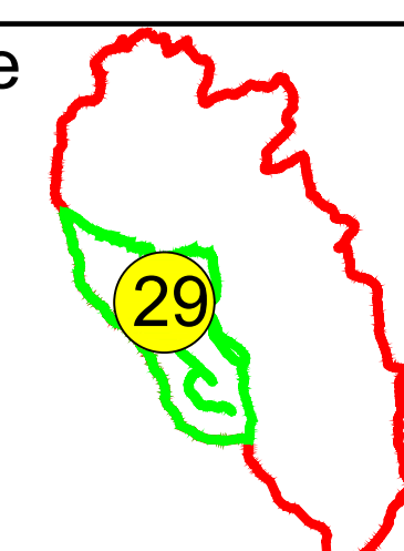
Schița cu dispunerea sectoarelor cadastrale