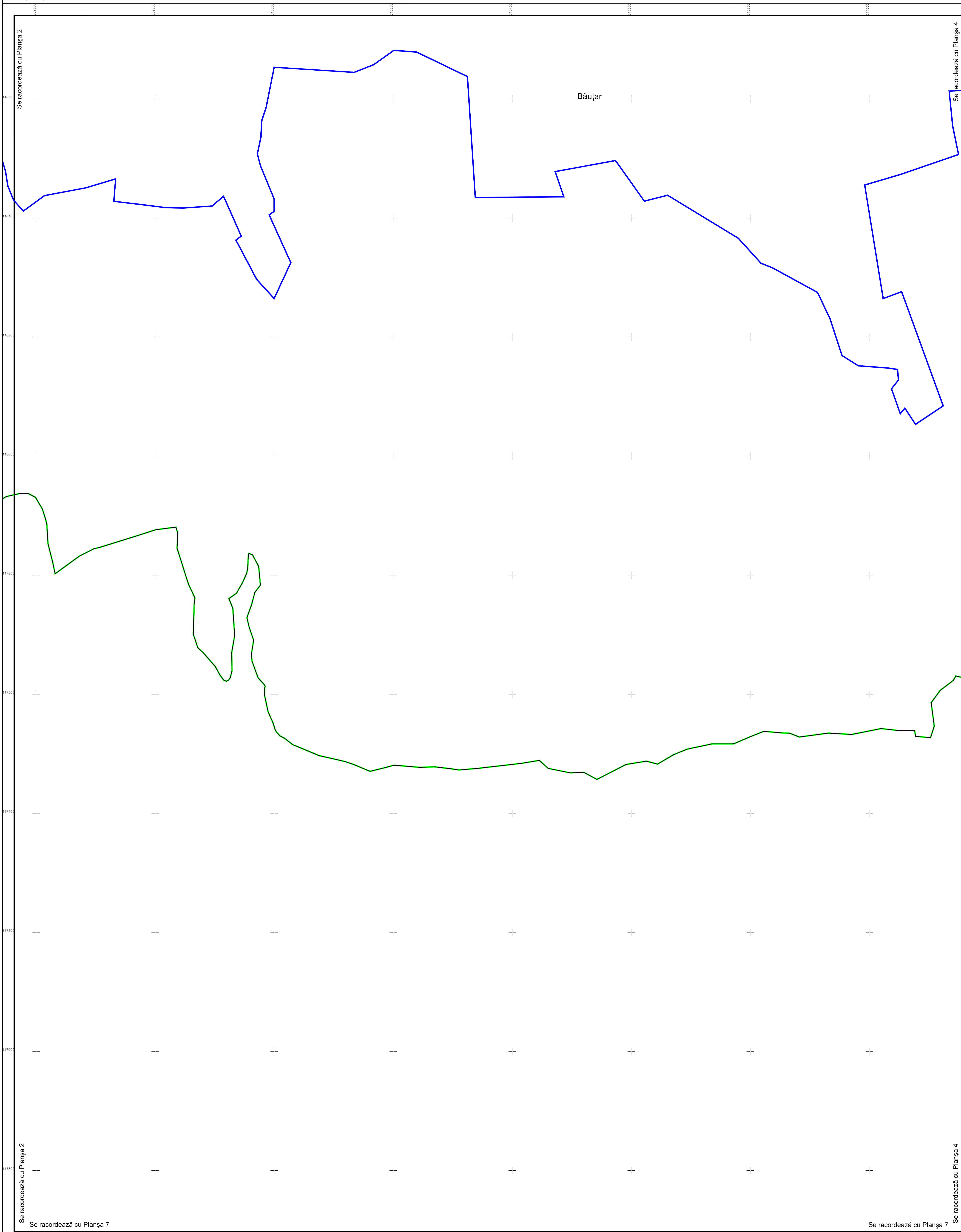
Schema de racordare a planșelor