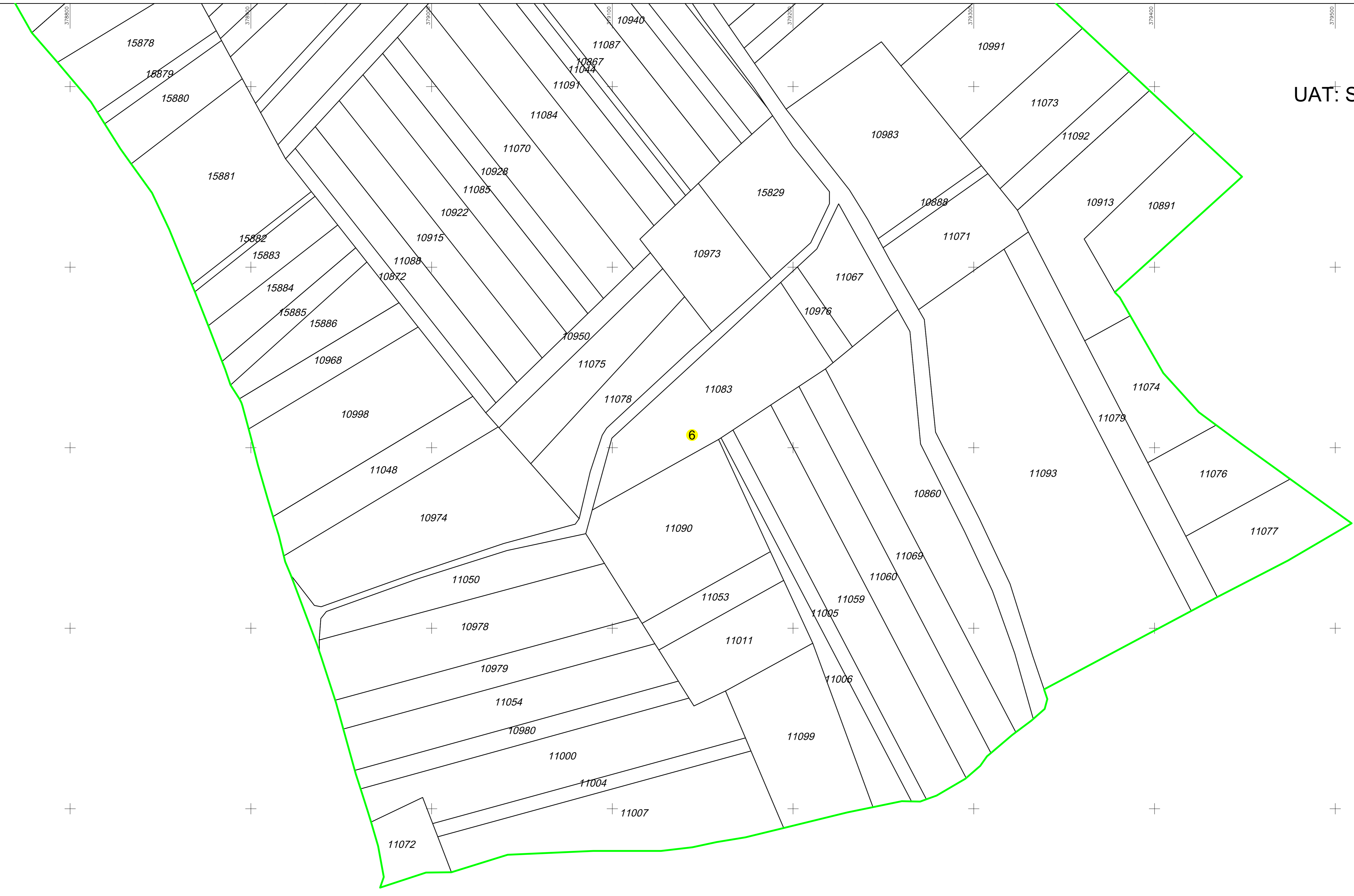
SCHEMA DE RACORDARE A PLANSELOR