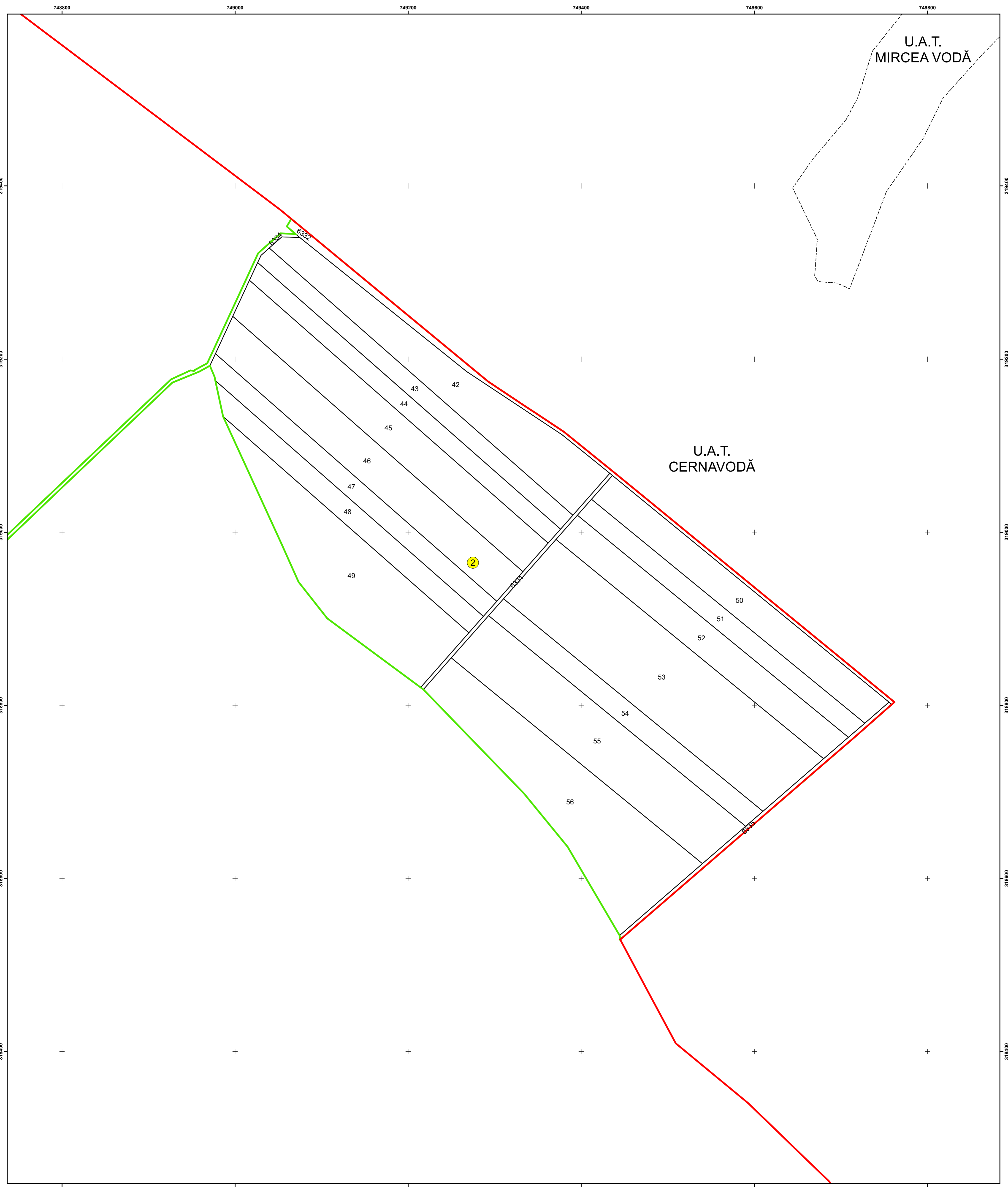
SCHIȚA DISPUNERII PLANȘELOR