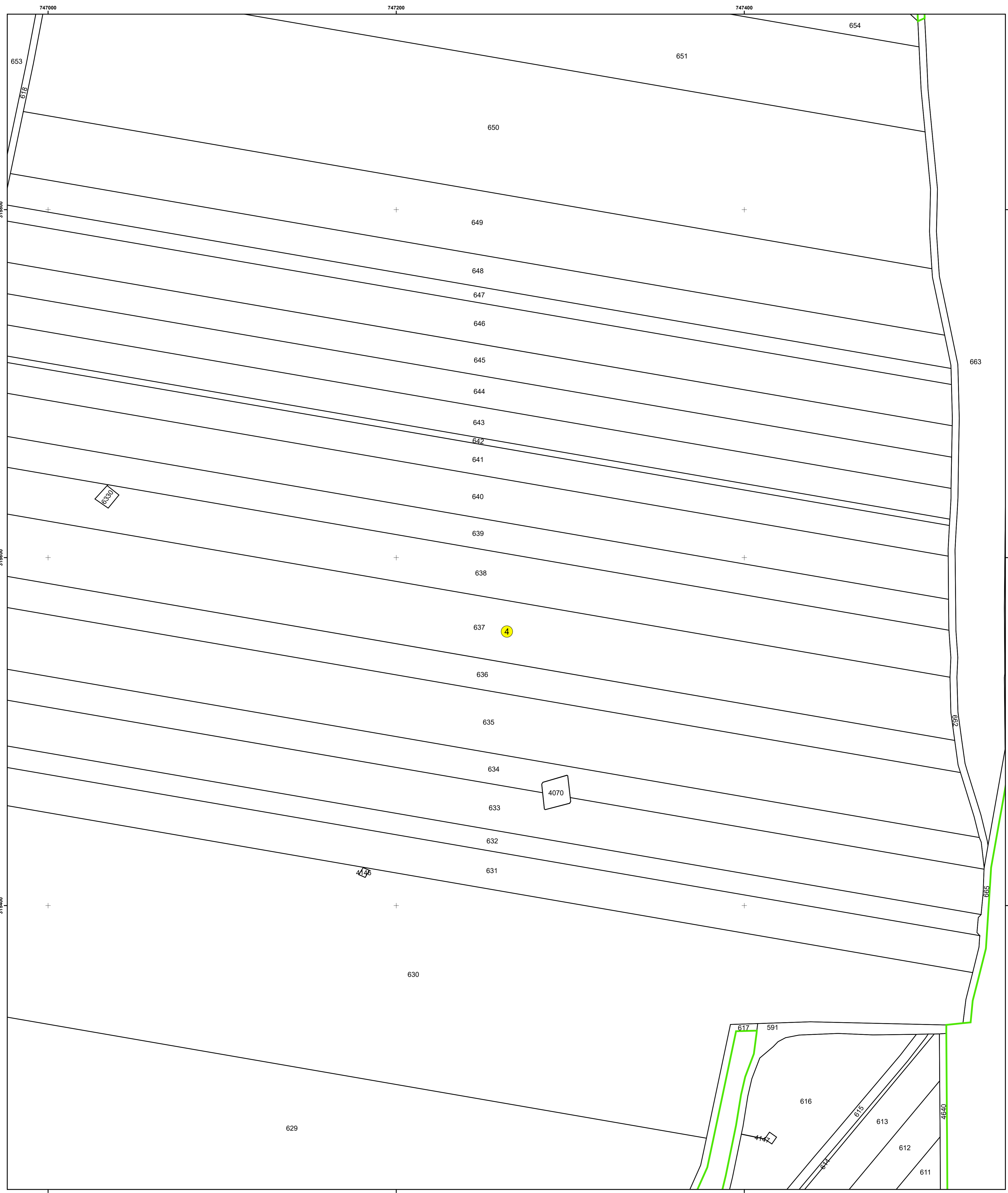
SCHIȚA DISPUNERII PLANȘELOR