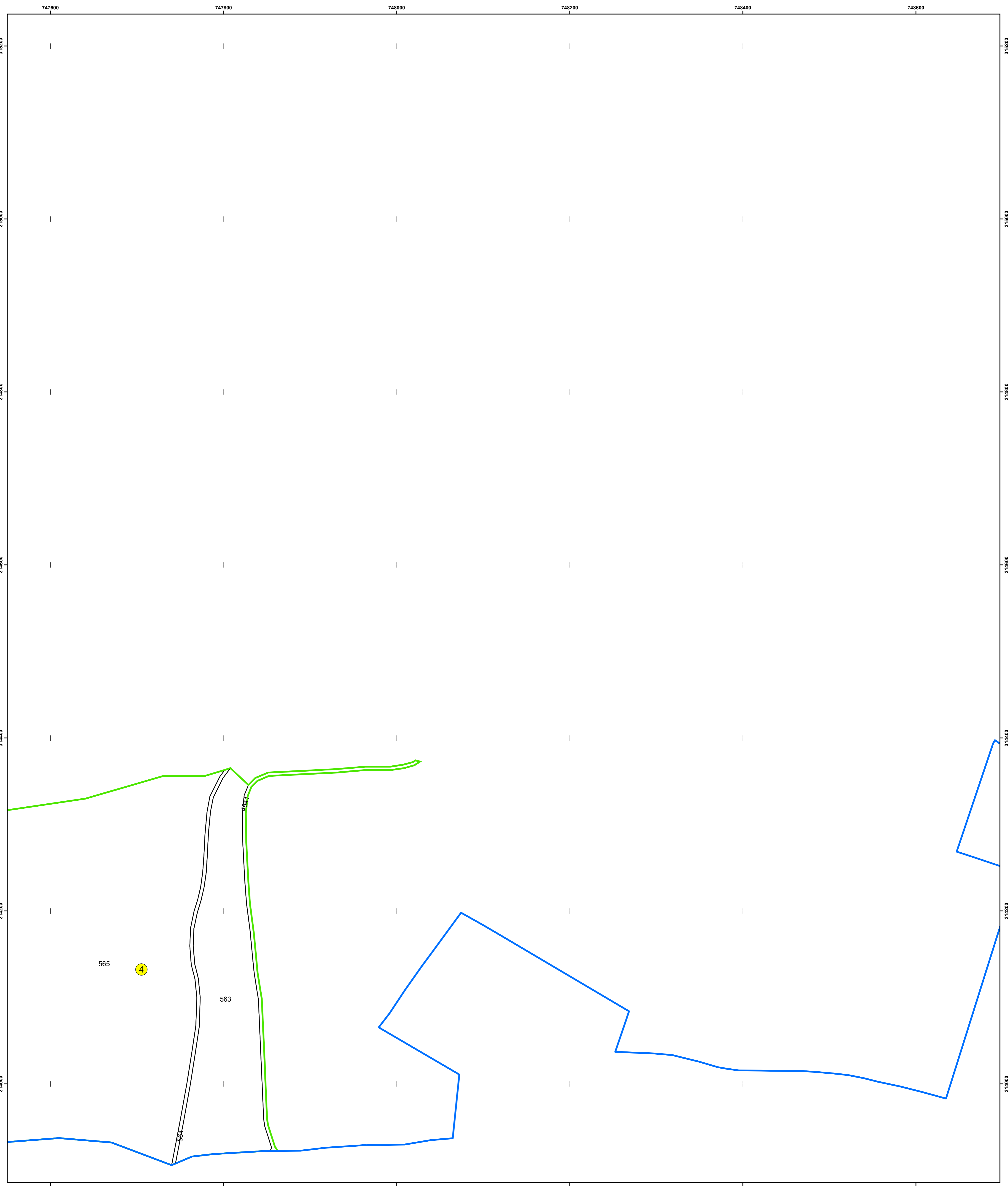
SCHIȚA DISPUNERII PLANȘELOR