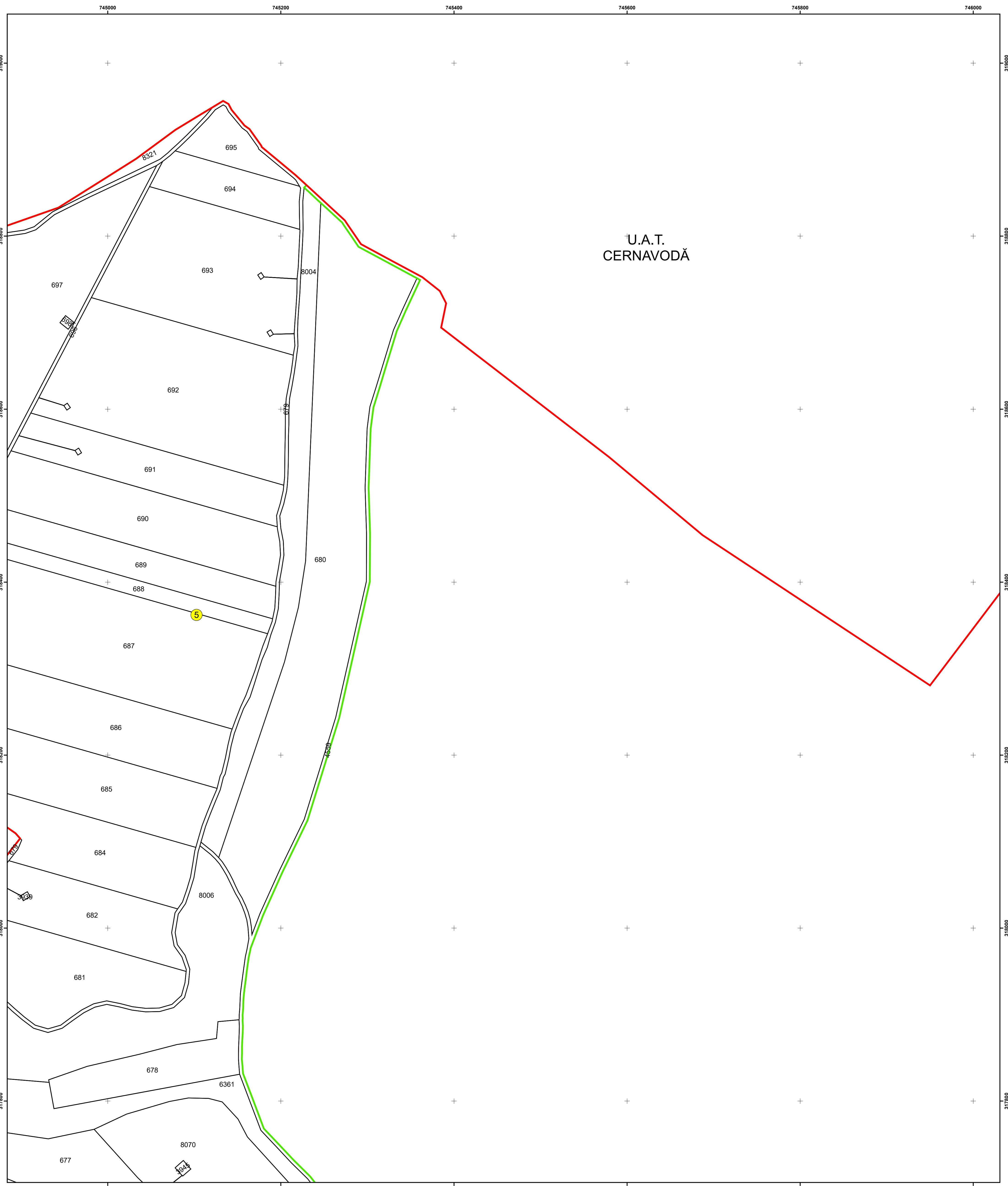
SCHIȚA DISPUNERII PLANȘELOR