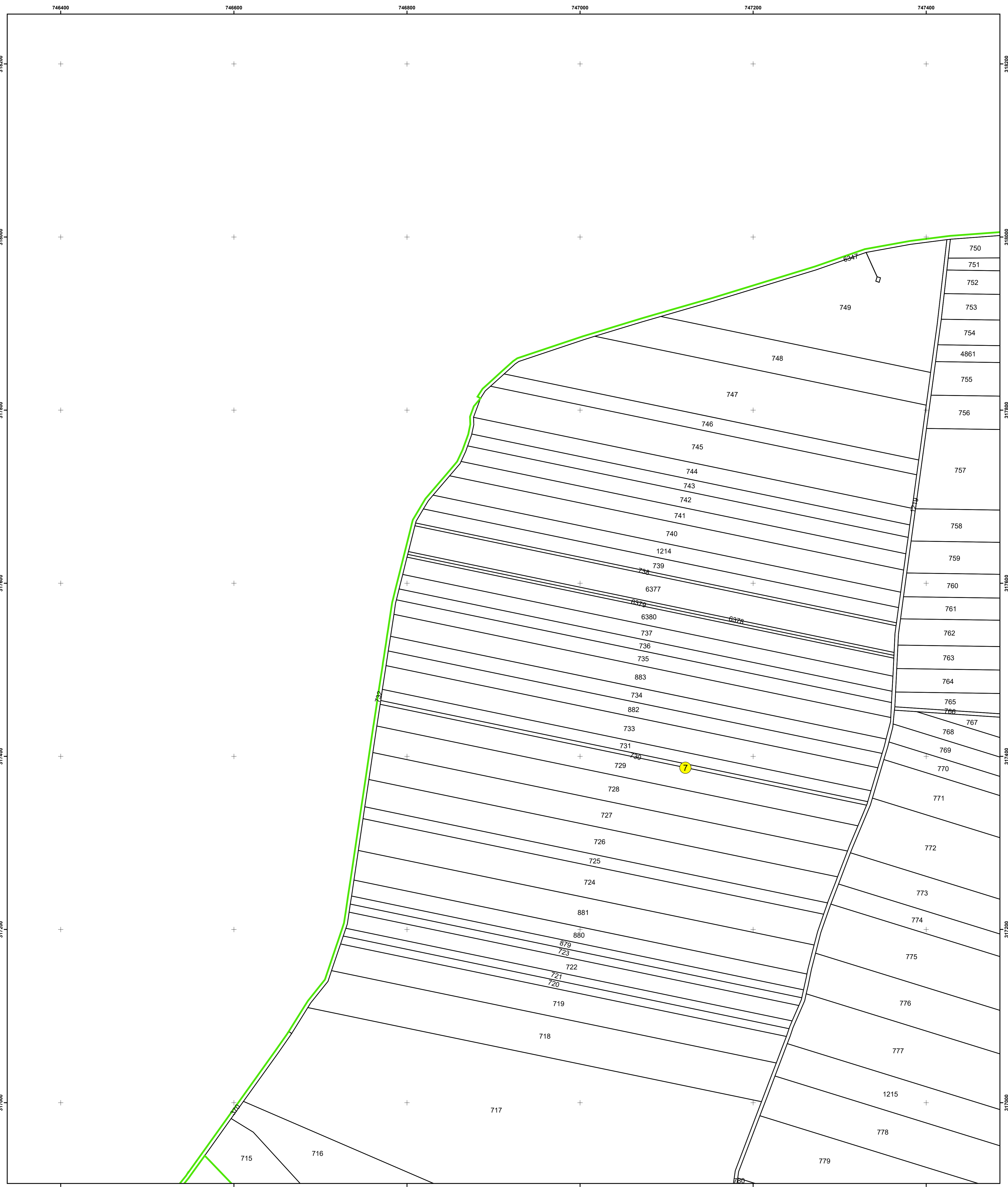
SCHIȚA DISPUNERII PLANȘELOR