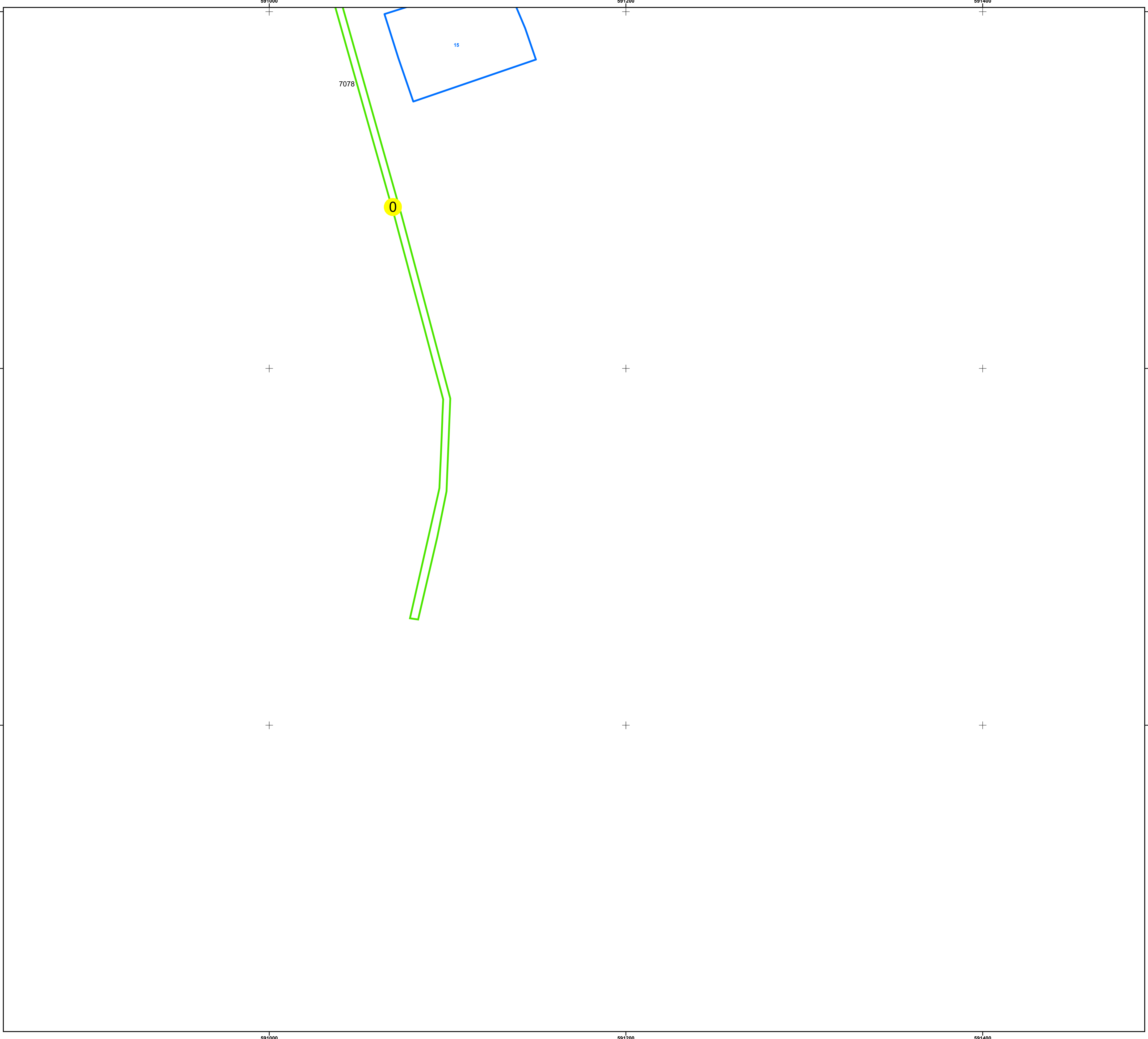
SCHIȚA DISPUNERII SECTOARELOR CADASTRALE