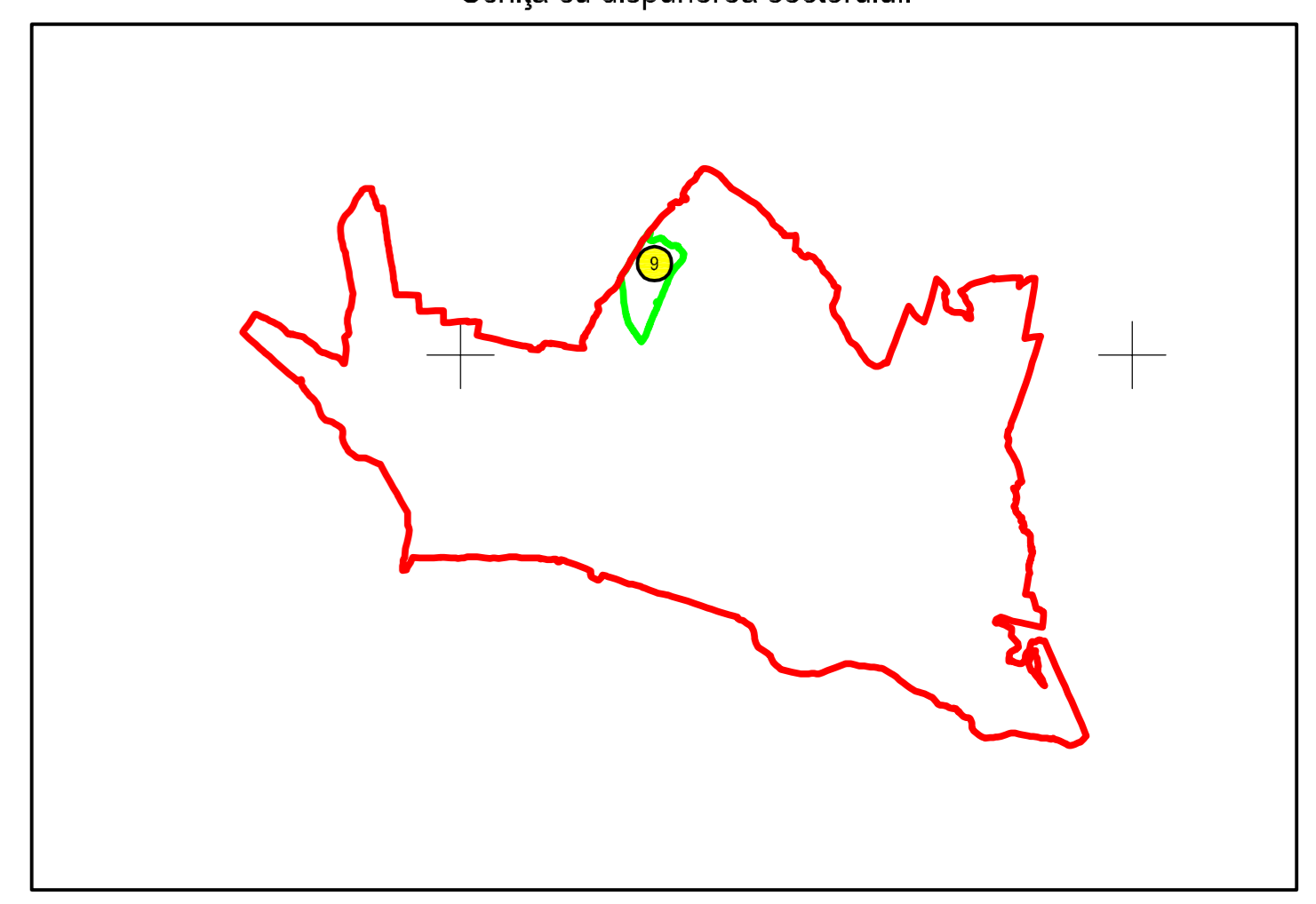
Schiță cu dispunerea sectorului:

Prestator: SC AZIMUT 2010 SRL Executant: ing. MOCANU VLAD-ILIE Data: 10.11.2023