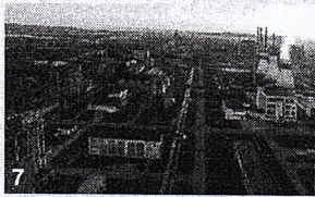
Chimcomplex anunță adoptarea „Planului de Măsuri de Precauție și Dezvoltare Accelerată” pentru anul 2024