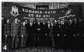
Participarea premierului Marcel Ciolacu la evenimentul „ROMÂNIA-NATO, 20 de ani”