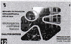
ARCUB lansează apelul de proiecte culturale în cadrul sesiunii de finanțare nerambursabilă „București 565. Conexiuni Urbane” 2024