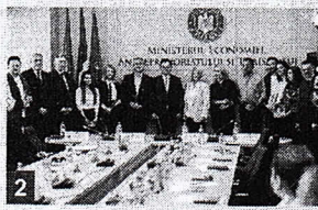
Lansare "Carta Albă Turismului din România" Ediția a 3-a